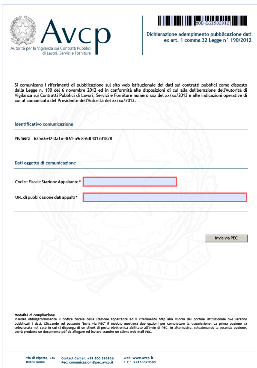
Figura 1 - Esempio di modulo per la dichiarazione di adempimento